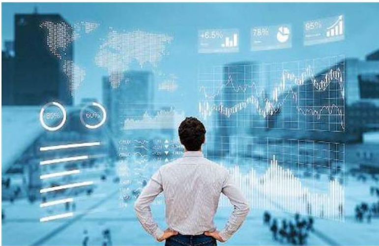
I numeri. Oggi Sme.Up conta 14 sedi, 450 collaboratori e un volume d'affari di 55 milioni