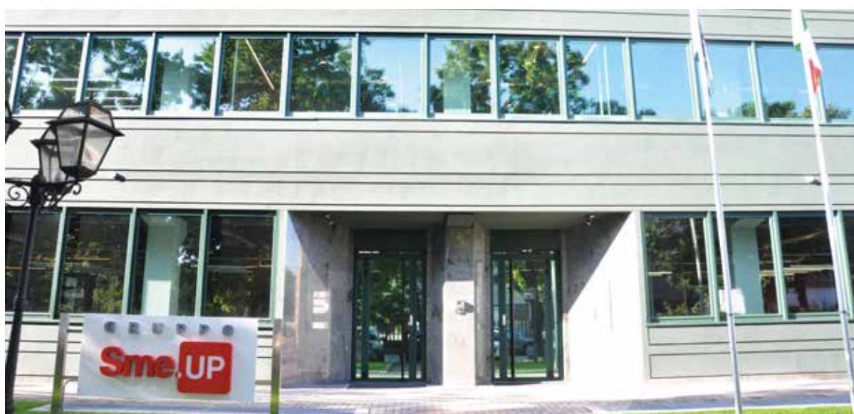
Punto di riferimento La sede del Gruppo Sme.UP

Strumenti L'applicazione è facile da consultare, anche da differenti device